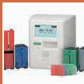
お薬飲み忘れ予防 【服薬支援ロボ】