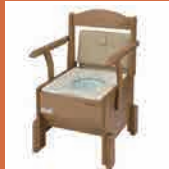
自動ラップ式トイレ 【ラップポン・プリオ(s)】