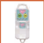
見守りセンサー 【守ってね】