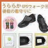
徘徊見守りシューズ 【うららか GPS ウォーク】