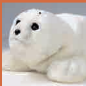
アザラシ型癒し系ロボット 【パロ】