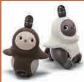
家庭用 AI ロボット 【LOVOT(らぼっと)】