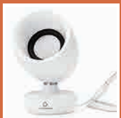
対話支援システム 【comuon】