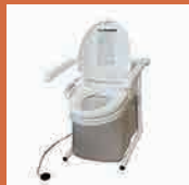
水洗式ポータブルトイレ 【流せるポータくん3号】