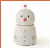
コミュニケーションロボット 【BOCCO emo LTE モデル】