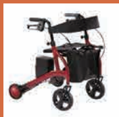
自動制御機能付き歩行器 【ロボットアシストウォーカー RT.2】