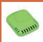
排便お知らせセンサー [Aiserv 排泄検知システム]