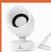
新しいカタチの 対話支援機器 [comuoon]