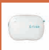
排泄予測デバイス [D-Free]