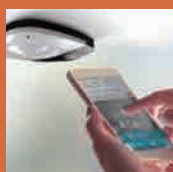
介護業務支援 [HitomeQ ケアサポート]