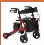
自動制御機能付き歩行器 [ロボットアシスト ウォーカー RT.2]