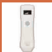
排尿タイミング 予測支援デバイス [リリアムスポット 2]