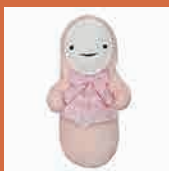
癒し型赤ちゃんロボット [スマイビ S]