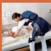
パワーアシストスーツ [介護作業用パワーアシスト スーツ J-PAS fleairy]