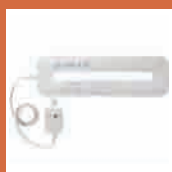
見守り介護ロボット [aams/ アームス]