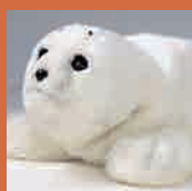
アザラシ型 セラピーロボット [パロ]