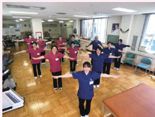
ソーシャルディスタンス！