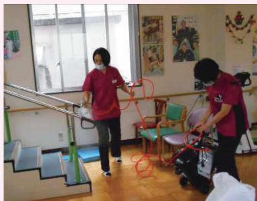
噴霧器にて消毒中

今後も八尾地区の地域包括ケアシステムの中での風の庭として地域に根差した施設としての役割を担っていけるよう取り組んでいきたいと思っています。